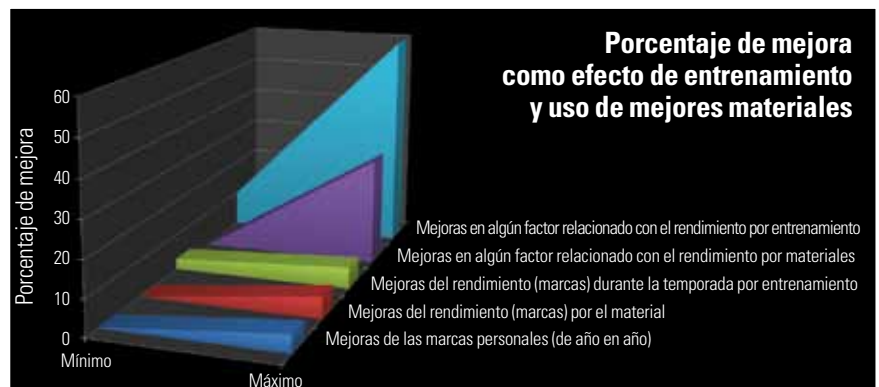
Figura 1. Efecto del Entrenamiento y del Material en el Rendimiento en el general de los deportes de resistencia.

Por tanto, lo primero a considerar es que el programa de entrenamiento esté bien pensado y controlado. Algo en lo que prestan poca atención muchos deportistas aficionados (y a veces entrenadores), a menudo, menos que en los materiales que adquieren. Para ello, un elemento clave es saber cómo medir su dureza. Este artículo muestra una propuesta que se basa tanto en la carga objetiva (comparable entre deportistas en nivel absoluto) como en la carga subjetiva (percepción de la dureza de entrenamiento, y por tanto comparando percepción de estrés ante determinadas cargas objetivas o cúmulo de situaciones de la vida de la persona).