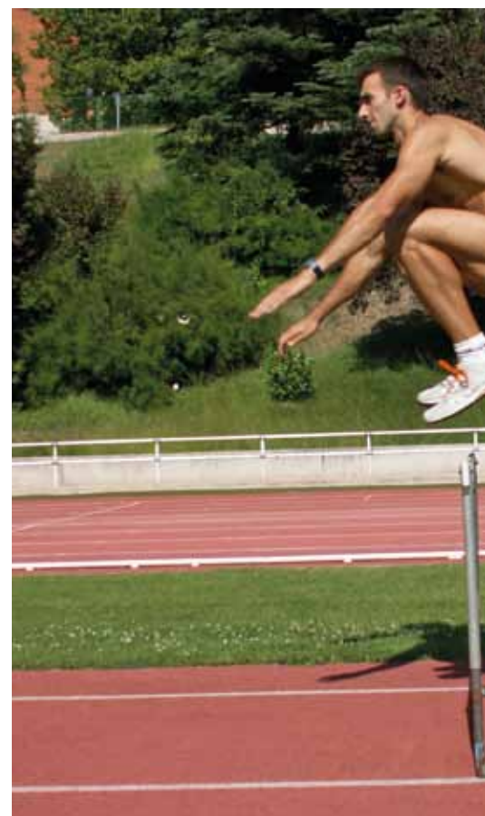
Figura 3. Ejemplo cuantificación (Propuesta 1).