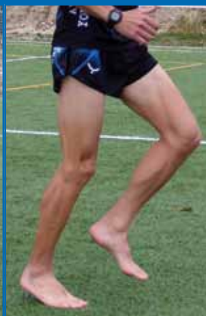
Fig. 3.8. Trote «de metatarso».