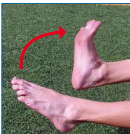
Fig. 3.1. Flexión-extensión de tobillo.