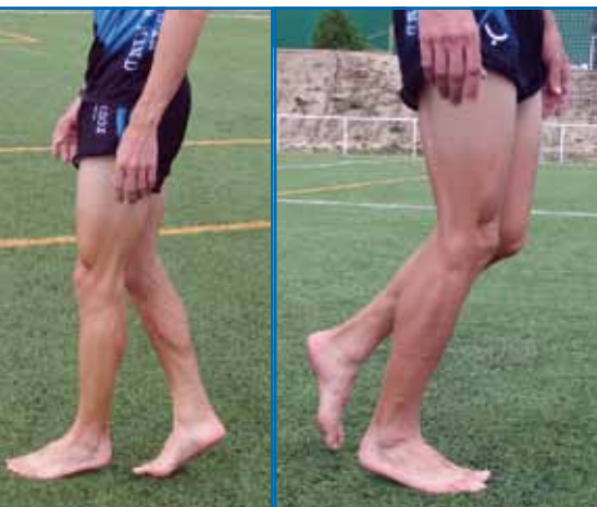
Fig. 3.5. Caminar metatarso-punta.

No hay evidencia científica alguna de que las zapatillas con amortiguación o corrección de la pronación afecten a que te lesiones más o menos (Richards et al, 2009).