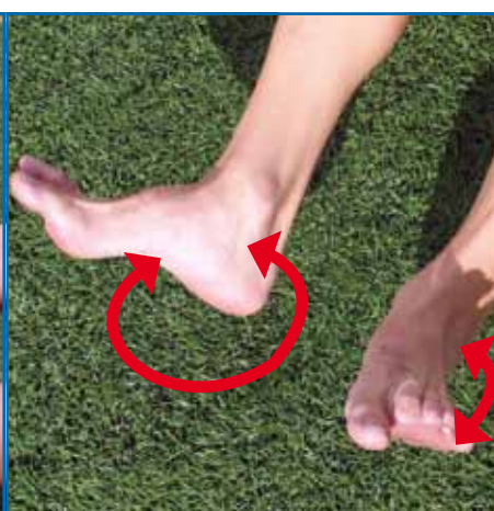
Fig. 3.2. Un pie en flexión y el otro en rotación de tobillo simultáneamente.