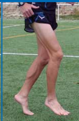
Fig. 3.9. Trote «de metatarso a punta».