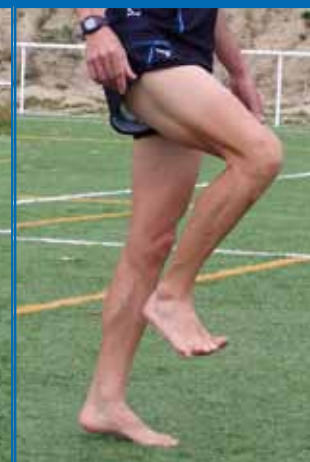
Fig. 3.11. Pie extendido-pie pistón.