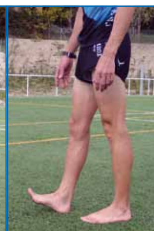
Fig. 3.4. Caminar talón-punta.