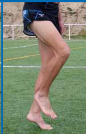
Fig. 3.10. Skipping bajo.