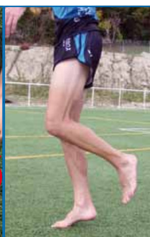
Fig. 3.3. Equilibrio «de metatarso».