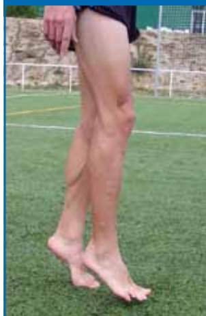
Fig. 3.7. Caminar «de punta».