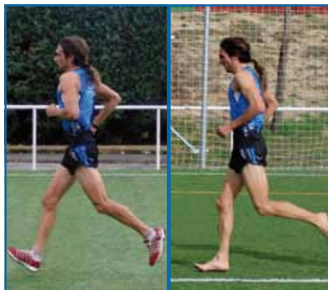
Figura 1. Comparativa entre correr de talón o de planta-metatarso.

La controversia se pone de manifiesto cuando se estudia a corredores que desde niños han corrido descalzos (como muchos africanos) o con un calzado muy básico (del tipo sandalia), o se consultan referencias históricas sobre la forma de correr de los