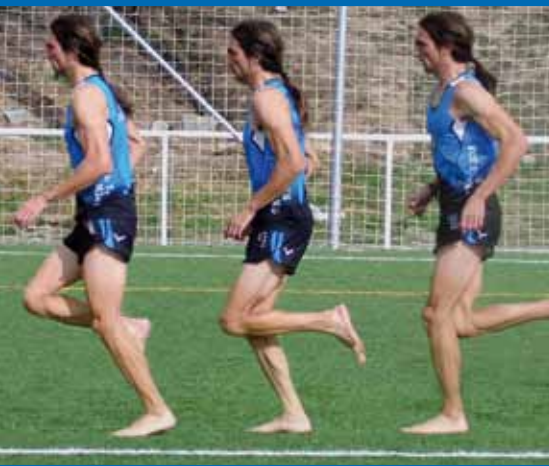
Fig. 3.12. Correr suave.

de los sistemas de amortiguación y control de la pisada también se van sumando al carro.