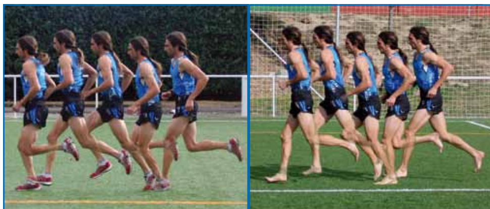
Figura 2. Trabajo del pie en la carrera de planta o metatarso. Fig. 2a. Carrera «de planta» calzado. Fig. 2b. Preparación que debe hacer del pie durante la carrera de planta o metatarso.

Y podemos suponer que si nos llevamos menos intensidad de golpes, o si estamos más fuertes para tolerarlos, nos lesionaremos menos o aguantaremos más intensidad o número de apoyos.