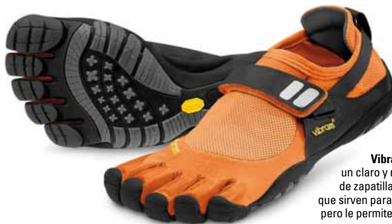
Vibram Fivefingers , un claro y radical ejemplo de zapatillas minimalistas, que sirven para proteger el pie pero le permiten total libertad.

traducido hace unos meses al español). No es menos cierto que muchos entrenadores de atletismo clásicos trabajaban ya la fuerza del pie, corriendo o haciendo ejercicios descalzo, desde décadas atrás. Si hasta los años '70 no había amortiguación en las zapatillas, es obvio que además muchas marcas se consiguieron con zapatillas extremadamente sencillas. Y hubo entrenadores que, incluso existiendo las